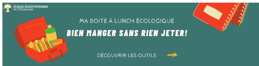
Bannière site web ou pied de courriels